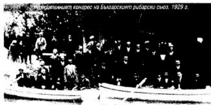
Учредителният конгрес на Българския рибарски съюз. 1929 г.

В Плевен се провежда Учредителният конгрес на Българския рибарски съюз. На него присъстват 34 делегати, представители на 11 дружества (габровското, дулишкото, ловешкото, пловдивското, плевенското, опичветското, софийското, станимашкото, тодорски мненското, чапеларското и ямболското). Приема се Устав и е избран Управителен съвет.