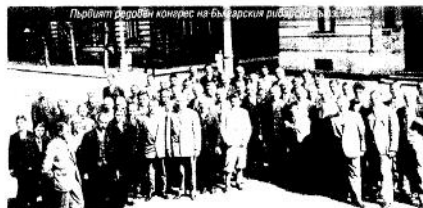
Първият редовен конгрес на българския рибарски съюз.

В София се провежда Първият обединителен конгрес между Българския рибарски съюз и Народната ловно-стрелческа организация „Сокол“. Става се началото на Народния ловно-рибарски съюз, чиято главна цел е опазването на българската природа.